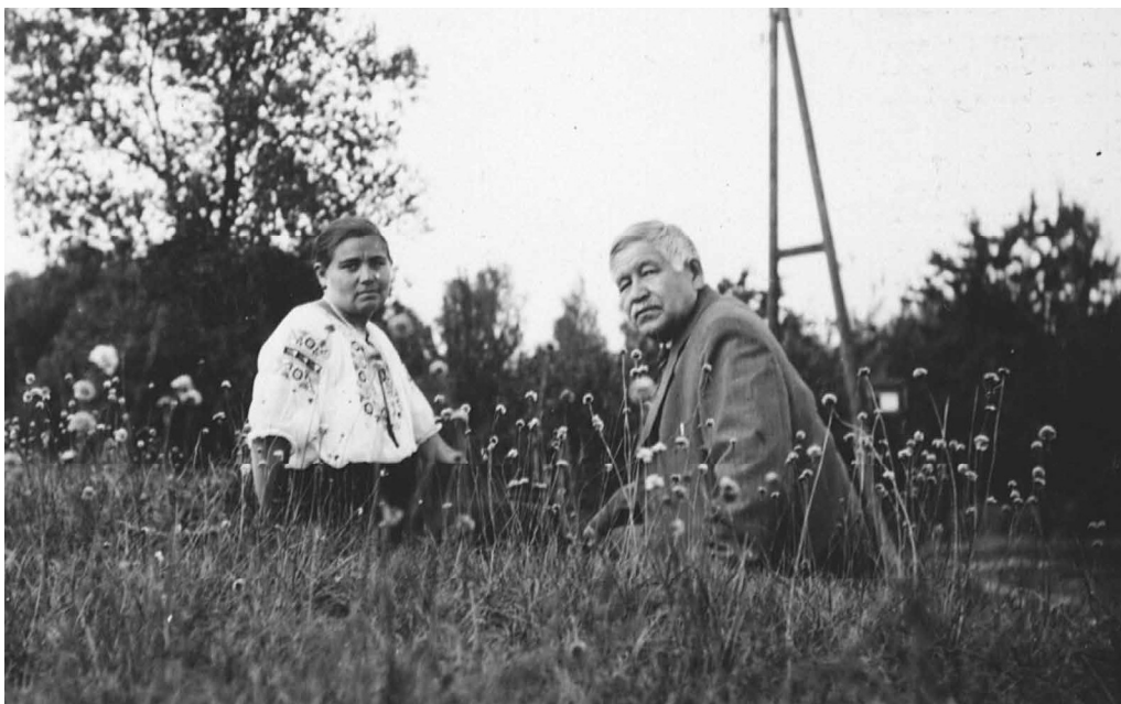
Г. Исхакый кызы Сәгадәт белән. Берлин, 1938 ел. ТР ФА Г. Ибраһимов ис. Тел, әдәбият һәм сәнгать институтының Язма мирас үзәге, 135 ф., 4 тасв., 32 сакл. бер.

G. Iskhaki with his daughter Sagadat. Berlin, 1938. Center of Written Heritage, G. Ibragimov Institute of Language, Literature and Art, the Academy of Sciences of the Republic of Tatarstan, fond 135, series 4, file 32.