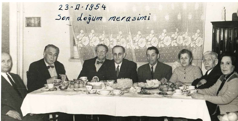
Г. Исхакыйның туган көн мәжлесе. 1954 ел. ТР ФА Г. Ибраһимов ис. Тел. әдәбият һәм сәнгать институтының Язма мирас үзәге, 135 ф., 4 тасв., 47 сакл. бер.

Celebration of G. Iskhaki's birthday. 1954. Center of Written Heritage, G. Ibragimov Institute of Language, Literature and Art, the Academy of Sciences of the Republic of Tatarstan, fond 135, series 4, file 47.